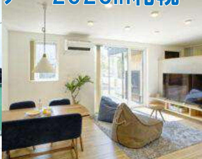
累計500名以上の方がご来場した、大好評の平屋モデル。 新築受注の50%以上が平屋？！最新の最新モデルを公開

高コスト新築x高性能リノベで年間100棟！“二刀流”経営視察 お問い合わせNo. S139895