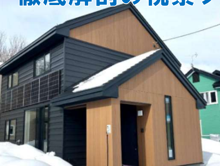
↑ 株式会社藤城建設も遂にリノベーション事業をスタート！ スタートから受注が止まらない、モデルハウスが見れる