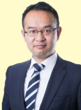
株式会社Villa Repro 代表取締役