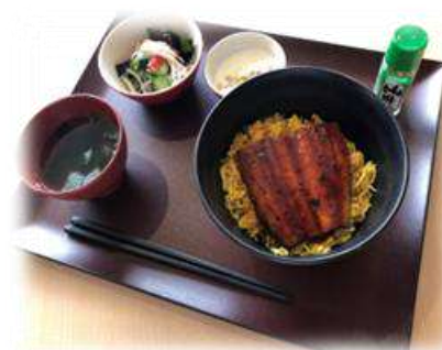
▲ある1日のメニュー