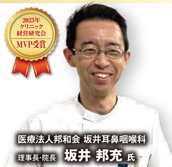
医療法人邦和会 坂井耳鼻咽喉科