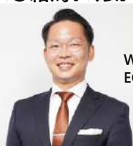
Webマーケティングの最先端 EC業界専門のコンサルタント