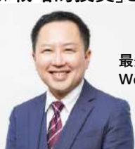
最先端のアパレル向け Webマーケティングのスペシャリスト