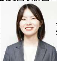
年間30本以上のサイト構築を行う ディレクションリーダー