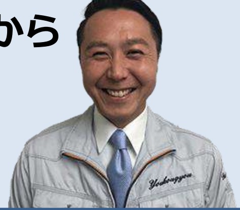
株式会社ユーペイント 代表取締役