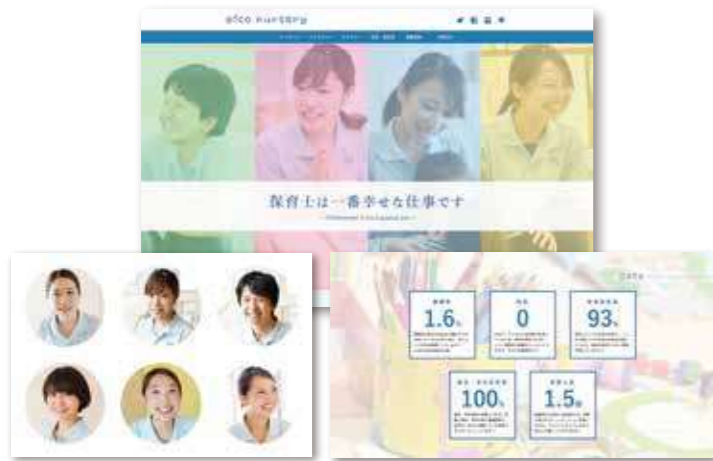
採用サイトで応募を大量獲得する方法