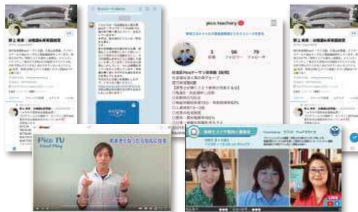
採用におけるそれぞれのSNSの実施方法・SNSでの採用方法