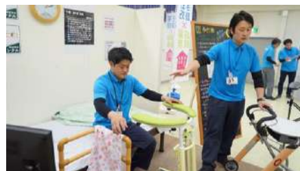
▲トータル提案プロジェクト（TTP）が全社共通の合言葉になり取り組みが加速しています。