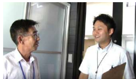
▲まったく「よそのもの」だった雰囲気が一変。レンタルも住改もどんどん相談が増えています。