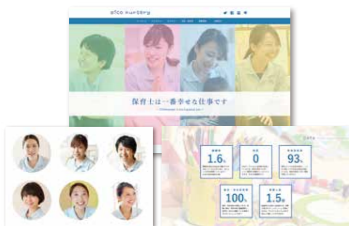
採用サイトで応募を大量獲得する方法