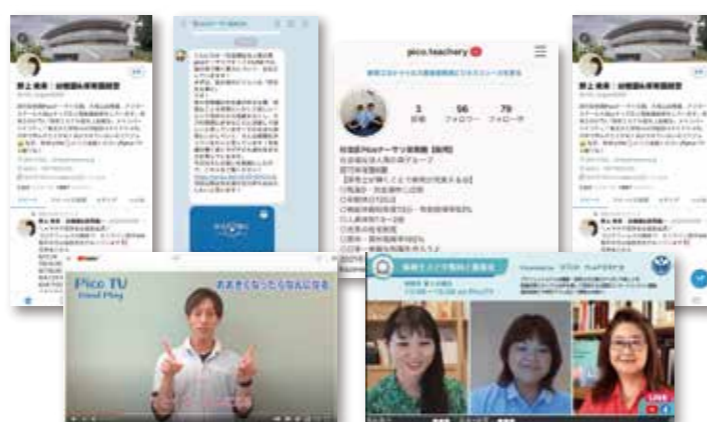
採用におけるそれぞれのSNSの実施方法・SNSでの採用方法