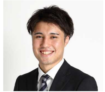
(株)船井総合研究所 建設支援部