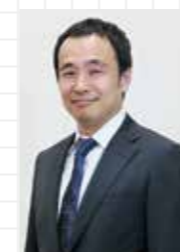
(株)船井総合研究所 地方創生支援部 食品・観光グループ 製菓・製パンチーム リーダー