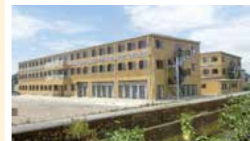
有料老人ホーム野いちごみつばち