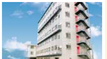
有料老人ホーム野いちご南国