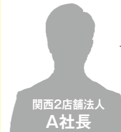
関西2店舗法人 A社長

新型コロナ以降営業損益赤字に転落しました。 そこで、コスト削減を実施し、三ヶ月後、黒字化へ。 ここでできた資金を投資することで業績回復を成功しました。