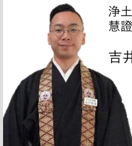
浄土真宗本願寺派 慧證山正光寺住職