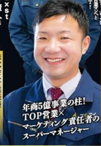
年商5億事業の柱! TOP営業× マーケティング責任者の スーパーマネージャー