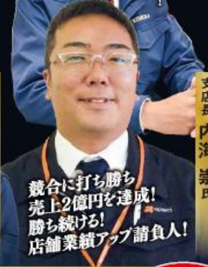
競合に打ち勝ち 売上2億円を達成! 勝ち続ける! 店舗業績アップ請負人!