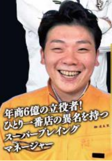
年商6億の立役者! ひとり一番店の異名を持つ スーパープレイング マネージャー