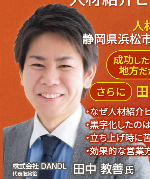
株式会社 DANDL 代表取締役