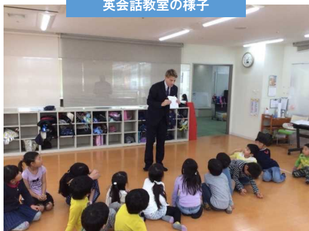
英会話教室の様子

このような取組みが地域に受け入れられ、3年目の今現在では、学童生約50名、スクール生150名程度となり、約200名の規模となりました。