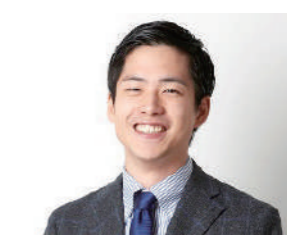
株式会社船井総合研究所 地域包括ケア支援部 地域包括ケアグループ

デイサービス、特別養護老人ホーム、有料老人ホームなどの新規開設、収支改善、異業種からの介護事業への新規参入支援などを手がける。現在は、デイサービスや有料老人ホームの利用者獲得や新規開設を中心にコンサルティングを行っている。介護事業所のコンサルティング以外にも、療養病床の転換や訪問診療など医療業界のコンサルティング実績や医療器具の販売促進支援など介護周辺事業についても実績を持つ。