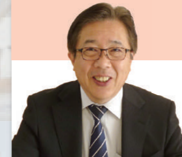
株式会社 リフシア 常務取締役