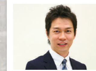
株式会社船井総合研究所 地域包括ケア支援部 地域包括ケアグループ グループマネージャー チーフ経営コンサルタント