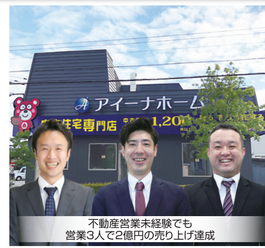
不動産営業未経験でも 営業3人で2億円の売り上げ達成