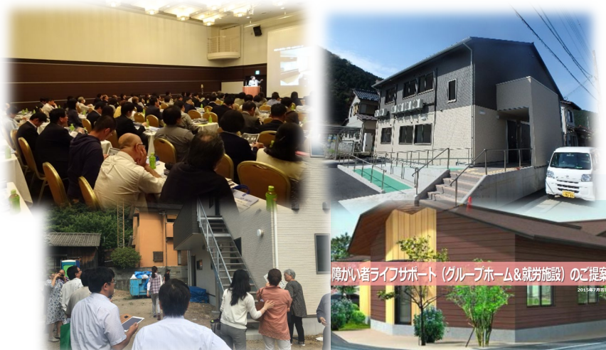
障がい者ライフサポート（グループホーム&就労施設）のご提案

弊社ではもともと土地活用提案の一環として高齢者の住宅を提案しておりました。しかし、昨今高齢者住宅も飽和状態になってきているようで、受注が思うように進まなくなってきました。何か新しい商品はないかと探していたところ、障がい者グループホーム事業のを知り、2016年から本格的に事業参入を行いました。まずはセミナーを開催したのですが100名以上の地主・投資家・不動産会社様にきていただき、社会貢献への思いに共感いただいたのか、大盛況でした。お越しいただいた地主さんからは6棟3.3億円を受注でき、地主さんからも非常に好評をいただいています。