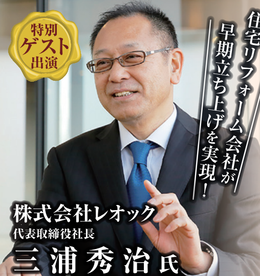
株式会社レオック 代表取締役社長

リフォーム会社、工務店、住宅会社からの 新規参入多数! 営業経験者なしでも可! 戸建リノベの スピード受注モデル!