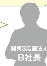
関東3店舗法人 B社長