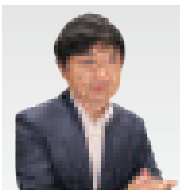
弁護士法人グレイス 代表弁護士