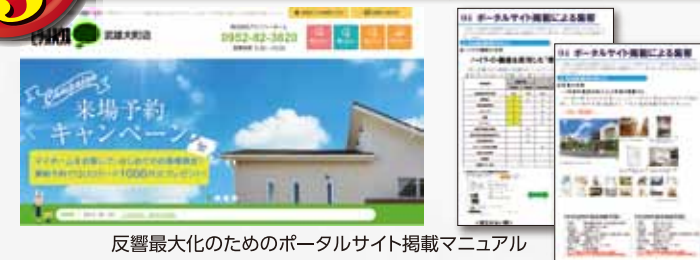
反響最大化のためのポータルサイト掲載マニュアル

地方はまだまだチラシ集客が1番!そんな風にお考えをお持ちではないでしょうか?リバーズ様では人口5万人以下のエリアにおいても今はWEBでの集客が中心です。ポータルサイトや自社サイトを中心に郊外エリアでいかに集客活動を行っているのかその秘訣をお聞きください。