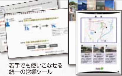
若手でも使いこなせる統一の営業ツール

3月で決算を迎えた前期は既存の営業2名に加えて、賃貸営業をこれまで行っていた新人営業マン1人を合わせた3名で60棟の販売を達成。1人あたり20棟販売という驚異の生産性を実現するリバーズ社の取り組みを特別に大公開いただきます。