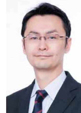
株式会社 船井総合研究所 フード支援部 部長 上席コンサルタント