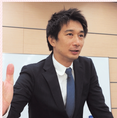
(株)船井総合研究所・賃貸支援部 シニア経営コンサルタント